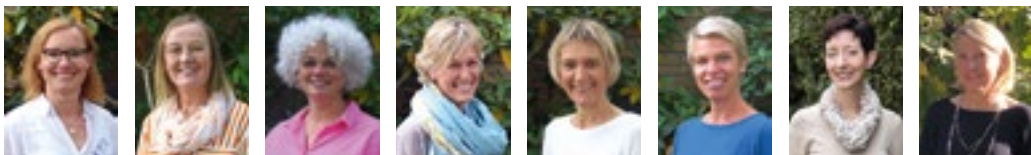
Ihr Team des FamilienForum Katharina

Wir freuen uns, dass Sie uns Ihr Vertrauen schenken und wir sind dankbar, dass wir Sie in dieser spannenden Zeit rund um Schwangerschaft, Geburt und Elternsein begleiten dürfen.